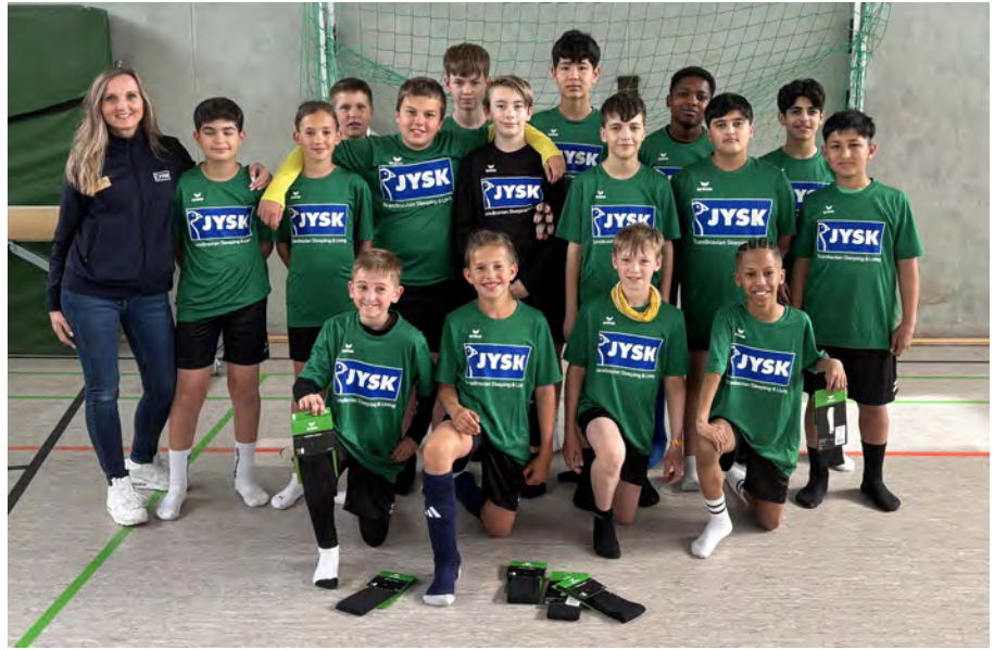
D-Jugend in neuen Trikots

Zu guter Letzt noch ein Wort in eigener Sache. Ein Jugendleiter sollte Feuer und Flamme für seine Tätigkeit aufbringen. Insbesondere die unerfreulichen Entwicklungen des Sommers haben dazu geführt, dass diese Voraussetzungen bei mir nicht mehr ausreichend vorhanden sind. Hinzu kommt meine Überzeugung, dass nach all den Jahren einfach mal frischer Wind in den Jugendfußball unseres Vereins