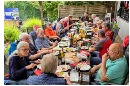
Französischer Nachmittag auf der Terrasse des AktivCenters

Zum Jahresende standen das Weihnachtessen am 27. November bei Radtke mit 26 Teilnehmern, sowie am 1. Dezember die Ausrichtung des Lebendigen