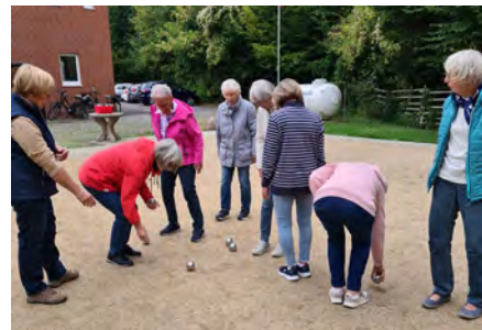
Sportlicher Ehrgeiz beim Boule