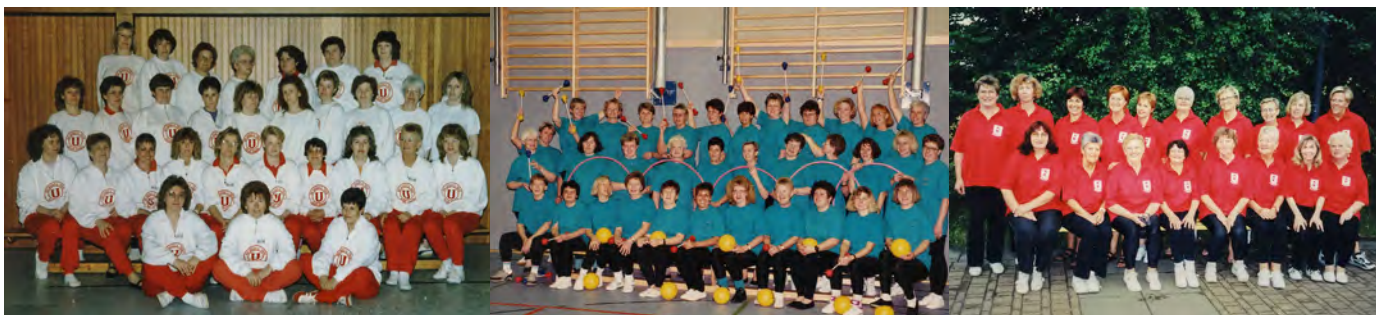
Die Farben ändern sich: Die Union Gymnastikdamen v.l. 1989, 1994 und 2003

Auch neuere Highlights gehören zur Geschichte: 2016 trugen die Gymnastikdamen maßgeblich zum Erfolg der REWE-Weihnachtswette bei. 130 verkleidete „Weihnachtsfrauen und -männer“ sangen gemeinsam ein Lied