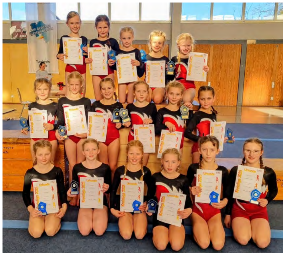
Kreiswettkampf Mannschaft am 22.11.25 in Wendezelle

Unsere Leistungsgruppe besteht aktuell aus 19 Kindern, die sonntags, in den altersentsprechenden