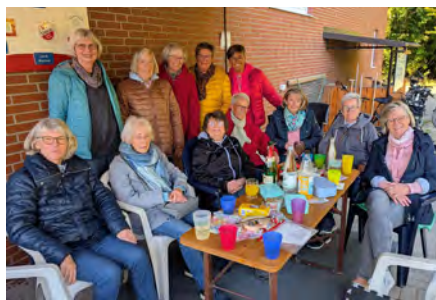
Gemütlichkeit auf der Bouleanlage

Anfang Oktober trafen wir uns zu einem Ausflug nach Goslar und erlebten einen wunderschönen Tag im Harz. Danke an das Orga-Team Petra und Annelie.