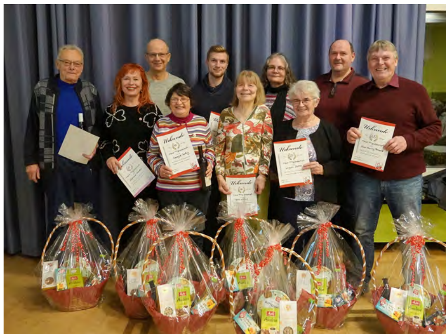
Die Geehrten für langjährige Mitgliedschaft