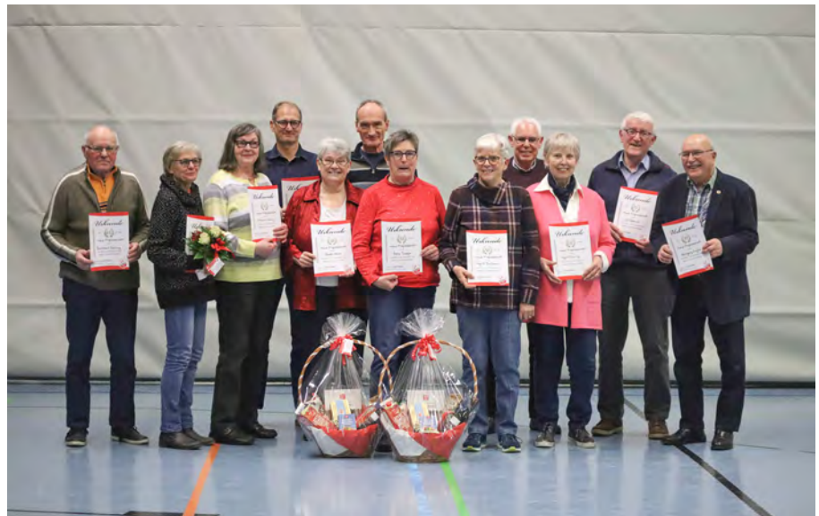
Ehrung für 50jährige Vereinsmitgliedschaft auf der MGV 2023

Jahrhundert voller Bewegung, Gemeinschaft und unzähliger schöner Momente. Heute geht es in den Übungsstunden etwas sanfter zu als früher: Gymnastikhocker gehören dazu, Rücken-