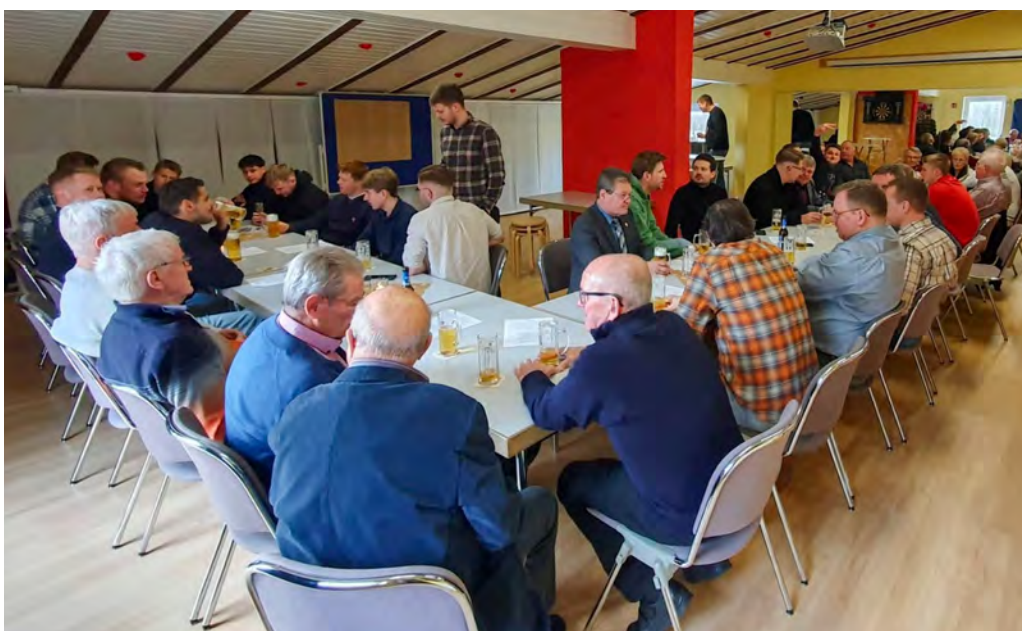
Gute Stimmung beim traditionellen Weihnachtsfrühschoppen 2024