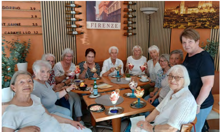
Ein Besuch vor den Ferien in der Eisdiele ist inzwischen schon Tradition.

Damit man in den Ferien nicht „einrostet“, ging es jeden Donnerstag zum Boulen. In den Pausen gab es natürlich Naschereien zur Stärkung.