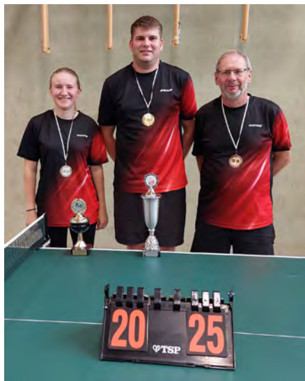
Die Champignons aus der kalten Hose

Das Turnier „Champion aus der kalten Hose“ (weil nach den Sommerferien ohne Training) hat sich inzwischen zu einem festen sportlichen Bestandteil unserer Spielgemeinschaft entwickelt.