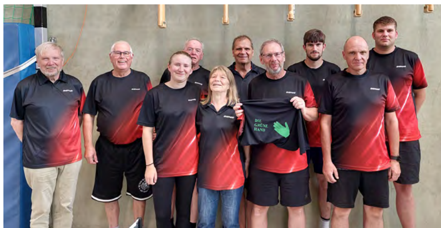
Die Teilnehmer am Turnier „Champion aus der kalten Hose“