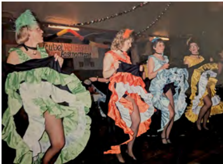
Cancon 1990 - Gemeindefastnacht