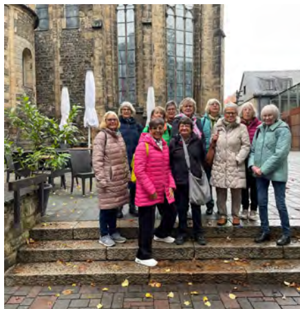
Ausflug nach Goslar

Die Zeiten, in denen die Halle aufgrund der Ferien oder vieler Renovierungsarbeiten geschlossen war, haben wir bestimmt nicht tatenlos auf dem Sofa verbracht. Gemeinsame Fahrradtouren im Peiner Land oder Boulen, übrigens, immer, naja fast immer, mit dem Wettergott auf unserer Seite, standen auf dem Programm.